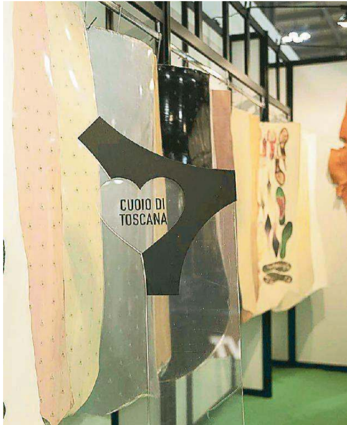
Il marchio Cuoio di Toscana

In occasione dell'evento, organizzato da Lineapelle, in collaborazione con Cuoio di Toscana, consorzio toscano leader nella produzione di cuoio da suola con quote di mercato pari all'80% in Europa e al 98% in Italia, si è parlato dell'arte della lavorazione del cuoio, e dei plus dei molteplici utilizzi nelle calzature in termini di stile, benessere e sostenibilità, con un affon-