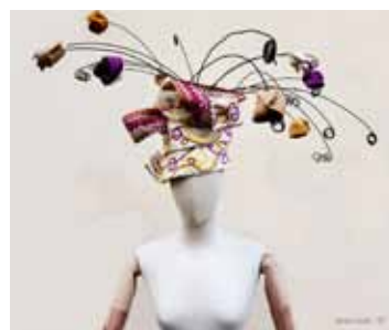
Maliparmi &amp; Alda Giunti