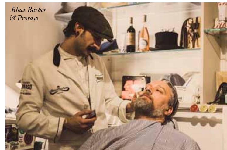
Blues Barber &amp; Proraso

attraverso il movimento corporeo, trovante supporto seduttivo e narrativo nella calzatura con suola by Cuoio di Toscana in concia lenta al vegetale, sinonimo di qualità oltremisura. Un raffinato dinner party ha, poi, deliziato ospiti in delirio per Francesco De Gregori. Mon Dieu, si dimenticava Vitale Barberis Canonico, che Liverano&Liverano, con la raffinata capsule del Cappellificio Biellese, creazioni in paglia e tessuto pregiato affiancate da originali cuffie in lana selezionata! Pardon. Quattro giorni per ritemperare