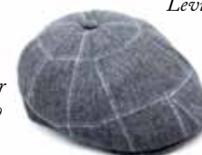
Vitale Barberis Canonico for Cappellificio Biellese