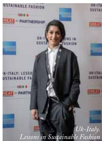
Uk-Italy. Lessons in Sustainable Fashion