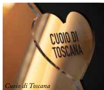
Cuoio di Toscana

attraverso il movimento corporeo, trovante supporto seduttivo e narrativo nella calzatura con suola by Cuoio di Toscana in concia lenta al vegetale, sinonimo di qualità oltremisura. Un raffinato dinner party ha, poi, deliziato ospiti in delirio per Francesco De Gregori. Mon Dieu, si dimenticava Vitale Barberis Canonico, che Liverano&Liverano, con la raffinata capsule del Cappellificio Biellese, creazioni in paglia e tessuto pregiato affiancate da originali cuffie in lana selezionata! Pardon. Quattro giorni per ritemperare